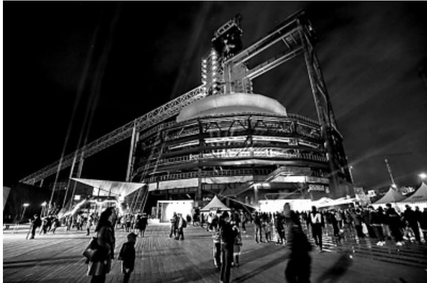
2020 中国科幻大会现场