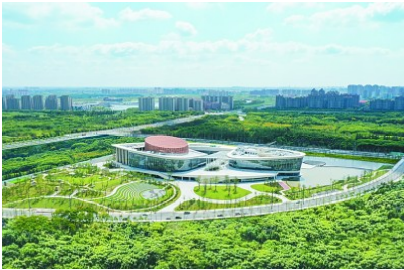
上海九棵树未来艺术中心

上海正在掀起新一轮剧场建设高潮。上一轮全国各地建设“大剧院”的风尚，也是由1998年落成的“上海大剧院”掀起的。在火热的大剧院建设潮流中，全国各地的“大剧院”纷沓而至，都成为城市的“文化地标”。然而，我们的大剧院不应该仅仅停留在“文化地标”的属性上，更应该成为城市的精神殿堂。透过一座座剧院和那里的艺术作品，我们应该能够窥得这座城市的文化气质和精神追求。